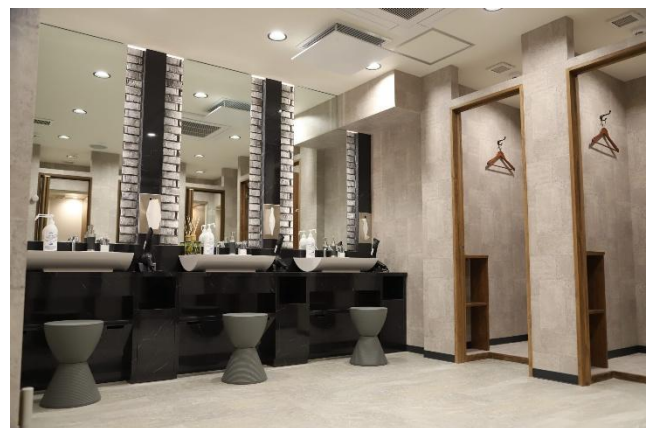
URBAN FIT24 ブランドイメージ